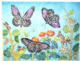
ツマムラサキマダラ