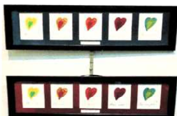
Je t'aime moi non plus