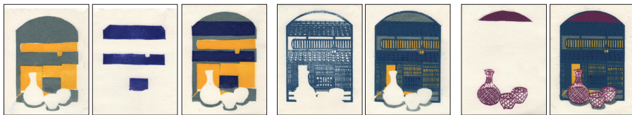
①+②=A ③ A+③=B ④ B+④=C ⑤ C+⑤=D