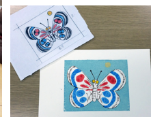
左：原画 右：コロジオン原紙とボールペン原紙（線）で制作した試作品