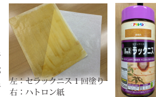
左：セラックニス1回塗り 右：ハترون紙